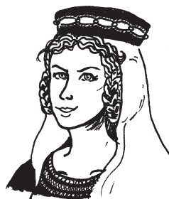
Blanka z Valois